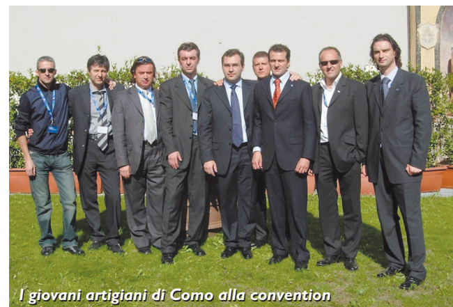
I giovani artigiani di Como alla convention

La tavola rotonda che ne è seguita, a conclusione dei lavori dell'assemblea, ha visto la partecipazione del Presi-